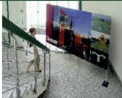
▲ Display Wand Basic