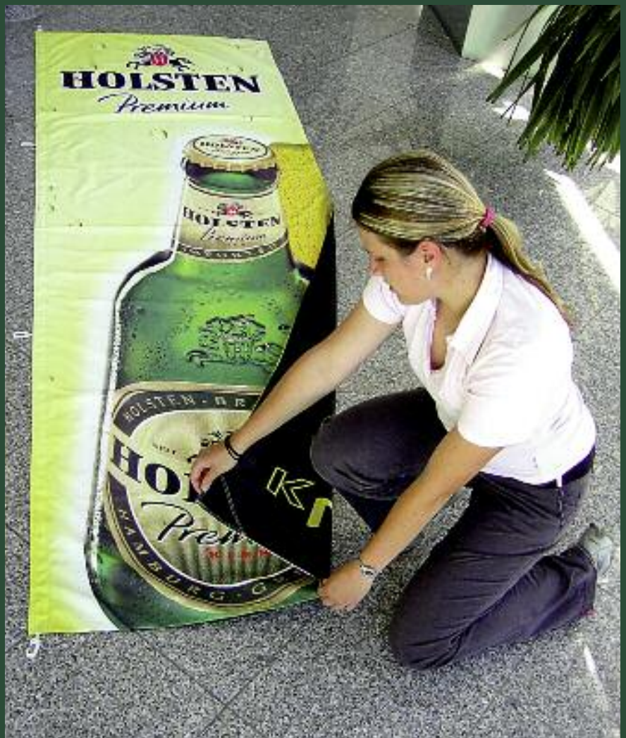
▲ Fahnen mit unterschiedlicher Gestaltung auf Vorder- und Rückseite