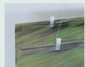
eingeklebter Metallstab mit Aufstecker und Distanzhalter