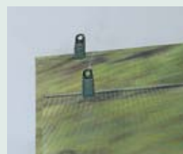
eingeklebter Metallstab mit Clipset