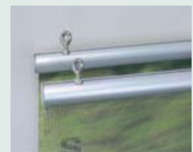
Alurundprofil mit Ösenschrauben

Da wir ständig an der Weiterentwicklung unserer Produkte arbeiten, müssen wir uns technische Änderungen sowie Toleranzen vorbehalten.