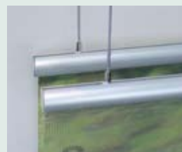
Alurundprofil mit Nutenstein inklusive Seil