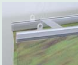
Kunststoffklemmschiene mit Distanzhalter