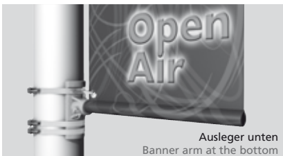
Ausleger unten Banner arm at the bottom