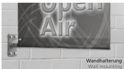
Wandhalterung Wall mounting

Street Banner Select können in windstärkeren Gebieten bis zu einer Windstärke von 9-10 Bft (75-100km/h) eingesetzt werden.